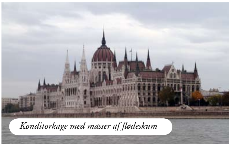
Konditorkage med masser af flødeskum

det træet efter et begivenhedsrigt og stort set søvnløst døgn, at jeg efter en smøgtur på peronen på en lille station ved etiden og efter at vi har haft et hold paspoliti ombord - hurra for, at det rødbedefarvede pas stadig på trods af Muhammed tegninger og Pia Kjærsgård stadig kun tiltrækker sig et hurtigt øjekast – falder jeg i søvn og vågner først rigtigt igen, da der er ca. en halv time til vi er fremme.