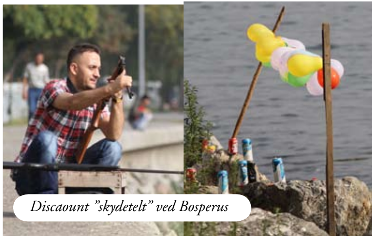
Discaunt "skydetelt" ved Bosperus