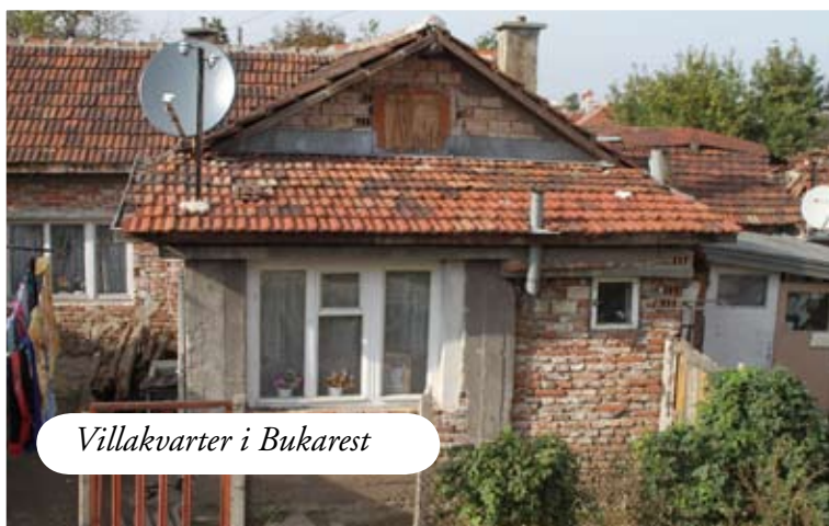
Villakvarter i Bukarest

men han forklarer, at jeg kan få en billig taxi til den rigtige station, lige derhenne på tankstationen. Samtidig gør han mig – helt korrekt - opmærksom på, at jeg nu er i en anden tidszone, så jeg har lidt travlt. Taxichaufføren vil ikke tage euro, så vi må lige omkring en hæveautomat. Jeg kender ikke kursen, men chaufføren har en gammel Planet Earth, hvor der står en kurs. Derefter kører vi længe rundt i et virvar af gader for at komme til den ”anden” station fra en ny vinkel. Vi er ved at have travlt og kan komme direkte til platformen. Jeg har næret en voksende mistanke til projektet under det meste af processen, men modviljen mod - endnu engang - at skulle se den videre plan gå i vasken, og erkendelsen af, at jeg er alene i en bil med to yngre fyre i et forholdsvist berygtet land, får mig til at hænge på. Da jeg sidder i toget, og på afgangstavlen har set, at det har det rigtige nummer, finder jeg selvfølgelig ud af, at jeg er tilbage på den oprindelige station.