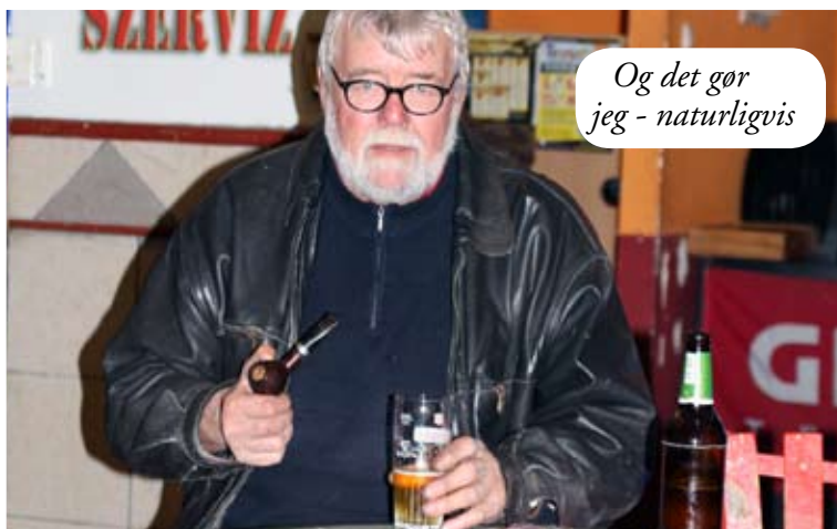
Og det gør jeg - naturligvis