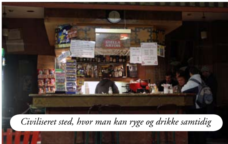
Civiliseret sted, hvor man kan ryge og drikke samtidig