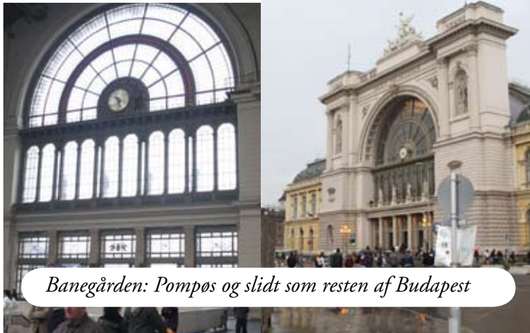
Banegården: Pompös og slidt som resten af Budapest