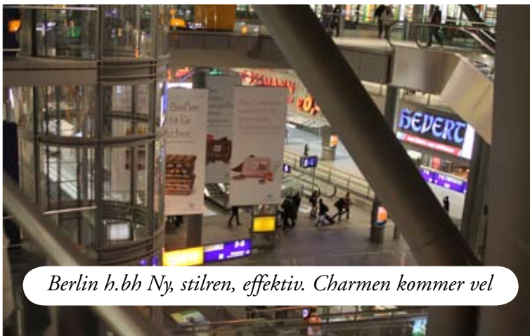
Berlin h.bh Ny, stilren, effektiv. Charmen kommer vel

I Lübeck sætter jeg et par Bundesbahn funktionærer i gang med at finde ud af, hvad jeg nu kan gøre. Heldigvis prøver jeg igen på kontoret i Hamburg, for det de kom op med, var den mest umulige samling skift og lange ventetider midt om natten på stationer, jeg aldrig har hørt om. På kontoret i Hamburg ender jeg med at acceptere, at Scandline har kostet mig en ekstra rejsedag. Jeg reserverer soveplads på et tog fra Berlin til Budapest sent om aftenen og leger turist i Hamburg indtil jeg skal med regionaltoget til Berlin. På den måde får jeg også en hel dag i Budapest, og det har jeg ikke noget imod, da jeg længe har haft lyst til lege turist der også. På Alstern er der kapsejls med rigtig mange både og masser af flotte spillere. Den engelske vending: "I would rather be sailing" falder mig ind, men det lykkes vel engang til foråret..