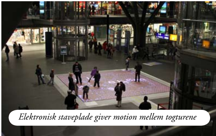
Elektronisk staveplade giver motion mellem togturene