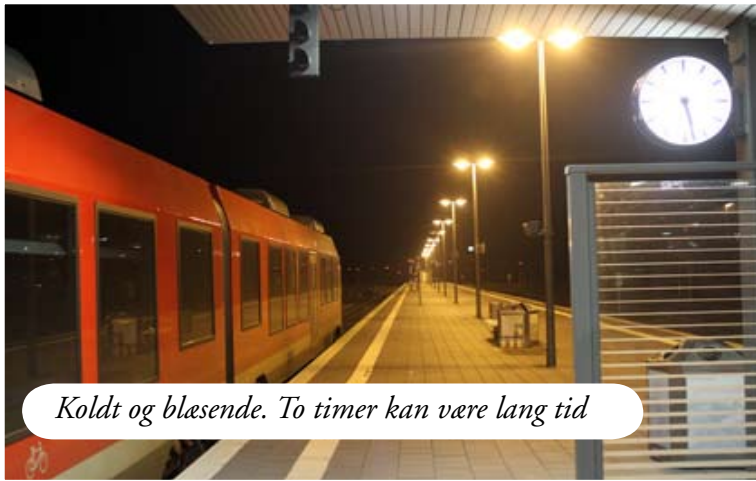
Koldt og blæsende. To timer kan være lang tid