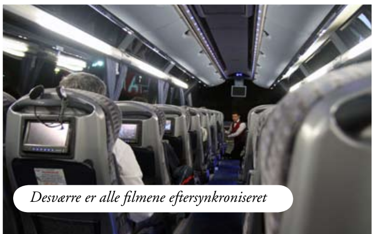
Desværre er alle filmene eftersynkroniseret

man netop har kørt tusind kilometer i tog som var mere end værdige til at stå sådan et sted. Der er lukket, så jeg får ikke set, hvad man på disse kanter betragter som museums-genstande.