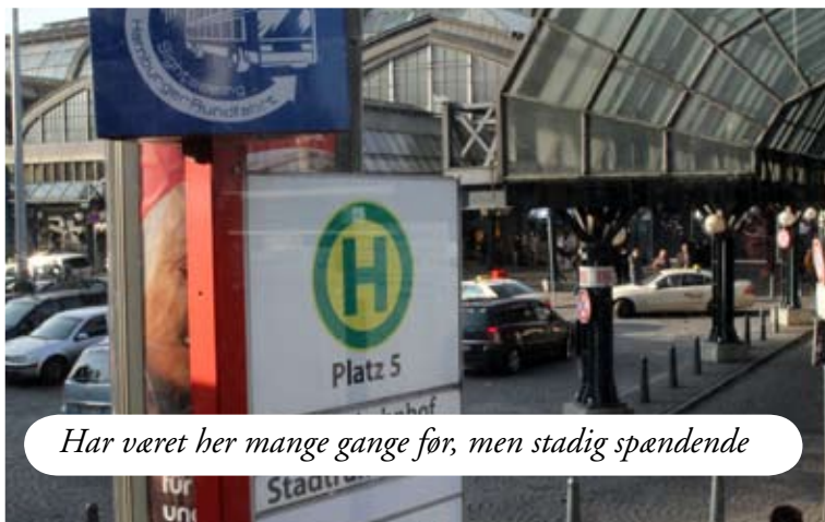
Har været her mange gange før, men stadig spændende