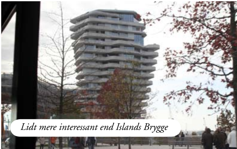
Lidt mere interessant end Islands Brygge