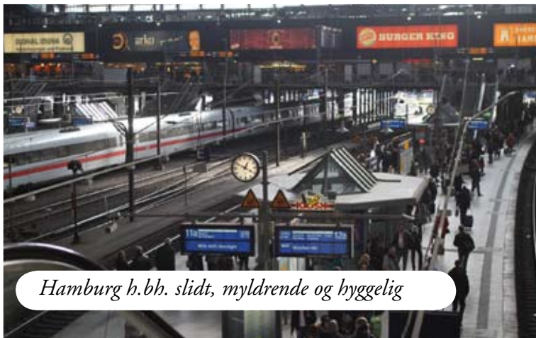
Hamburg h.bb. slidt, myldrende og hyggelig