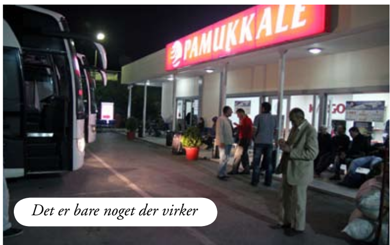
Det er bare noget der virker